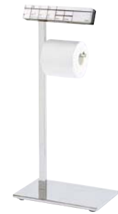
写真はスマートリモコンとのセットです。